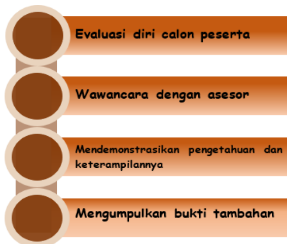
Gambar 2.1 Asesmen CP

Asesmen untuk pengakuan CP yang berasal dari pendidikan nonformal, informal, dan/atau pengalaman kerja dilakukan dengan mengikuti tahapan sebagai berikut.