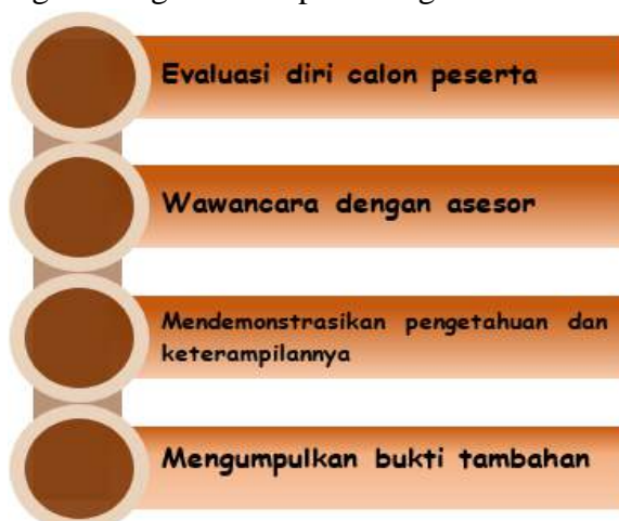
Gambar 2.1 Asesmen CP

Asesmen untuk pengakuan CP yang berasal dari pendidikan nonformal, informal, dan/atau pengalaman kerja dilakukan dengan mengikuti tahapan sebagai berikut.